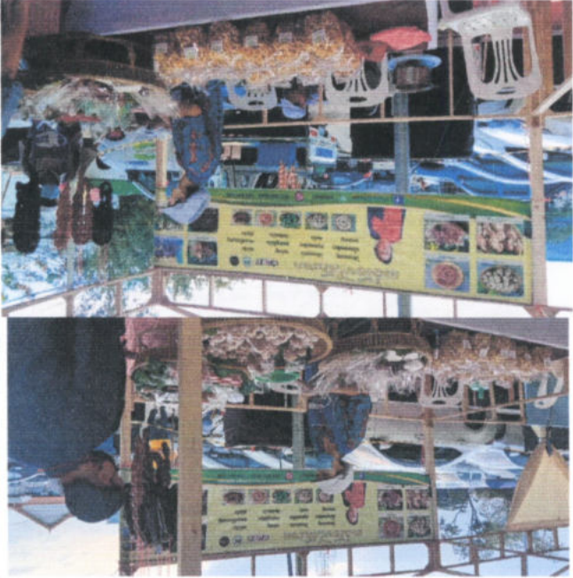
ร้านของฝากสินค้าชุมชน แม่ฮ่องสอน

แม่ฮ่องสอนมีของฝากให้เลือกซื้อเยอะแยะมากมายทั้งของสดและของแปรรูป มากมายทั้งผักผลไม้สดๆและของแปรรูปต่างๆที่คัดสรรมาเป็นอย่างดี ราคาต่อตัว: 101 - 250 บาท