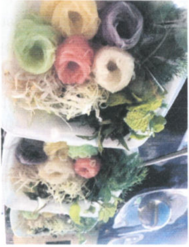
จังหวัดภาคเหนือ องค์การบริหารส่วนตำบลหางสาด อำเภอหางสาด

ร้านนี้คือทางไปของคนที่อยากไปเที่ยวชมสวนผลไม้และสวนเกษตรต่างๆในจังหวัดเชียงใหม่ ร้านนี้เป็นที่ที่คนเชียงใหม่และนักท่องเที่ยวจากทั่วทุกมุมโลกต่างก็มาเที่ยวชมและซื้อของ มากมายทั้งผักผลไม้สดๆและของแปรรูปต่างๆที่คัดสรรมาเป็นอย่างดี ราคาต่อตัว: 101 - 250 บาท