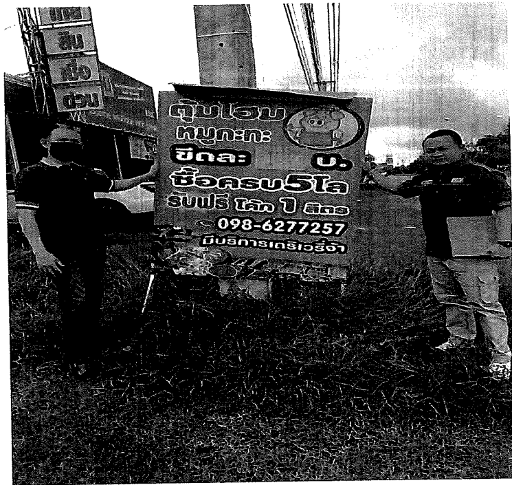
ภาพประกอบการออกสำรวจป้ายโฆษณาที่รुक้าทางสาธารณะ