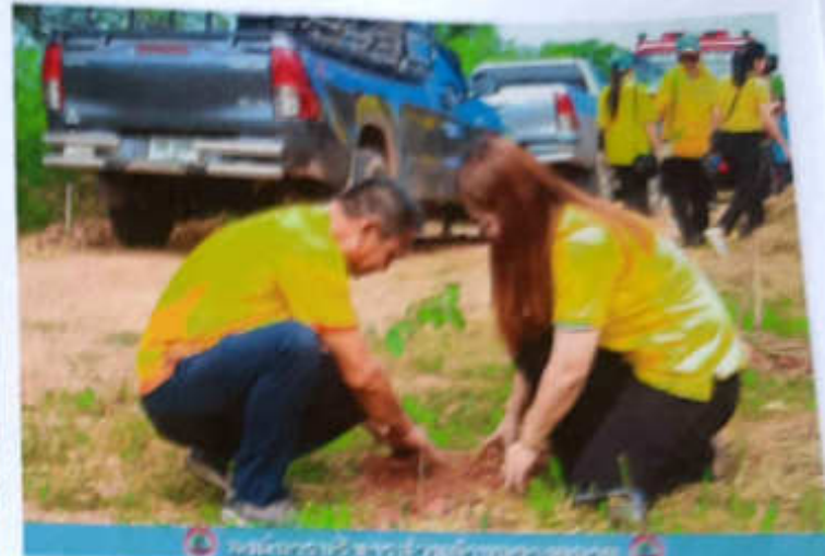
องค์การบริหารส่วนตำบลยางตลาด