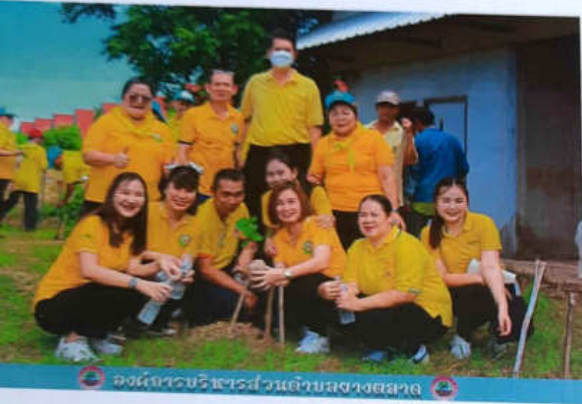
องค์การบริหารส่วนตำบลยางตลาด