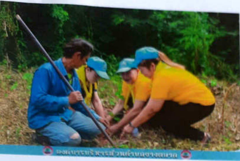
องค์การบริหารส่วนตำบลยางตลาด